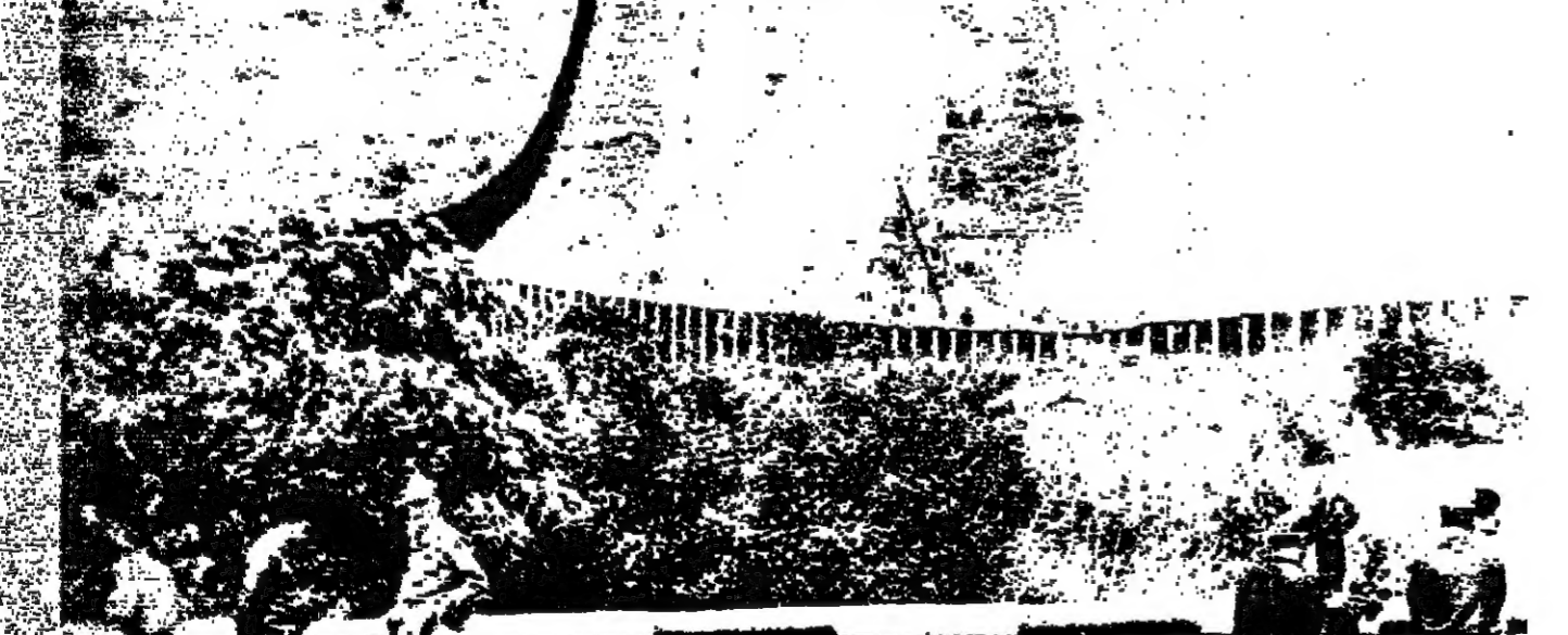
مشهد من الحدود مأخوذ من المانيا الغربية ، ويظهر بعض اراضي المانيا الشرقية